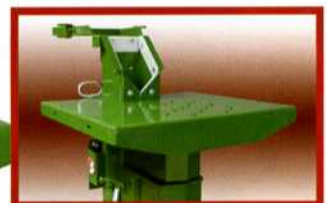
Führungen Modell M Prof.

STEUERUNGEN: Ergonomisch ausgerichtete Zweihand-Steuerung für den Spaltvorgang.